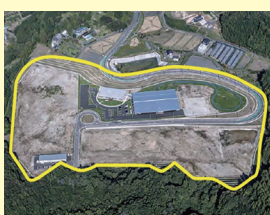
川俣西部工業団地