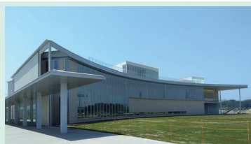
東日本大震災・原子力災害伝承館