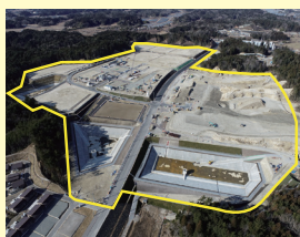
浪江町南産業団地