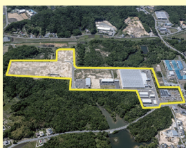
下太田工業団地 (南相馬市)