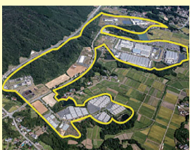
相馬中核工業団地 (西地区)