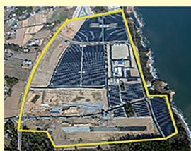
浪江町棚塩産業団地