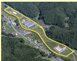
田ノ入工業団地 (川内村)