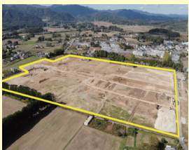
大熊中央産業拠点