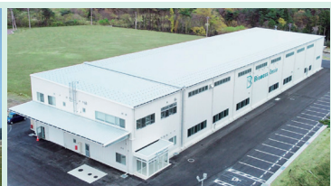
(株)バイオマスレジン福島