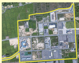
中野地区復興産業拠点 (双葉町)