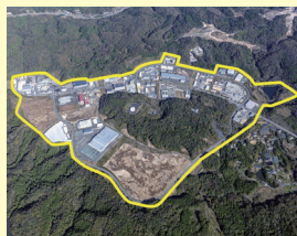
いわき四倉中核工業団地