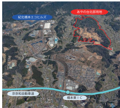
あやの台北部用地(第一次事業)分譲区画図