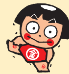
よいしょの金太郎