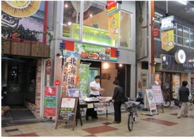
天神橋筋商店街の空き店舗を活用