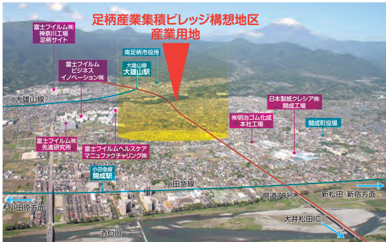
土地利用計画図(素案)