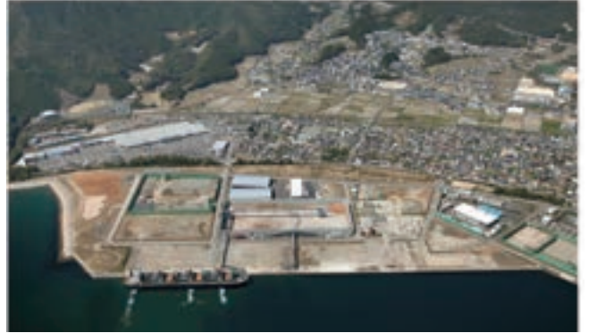
新宮港第二期工業用地全景