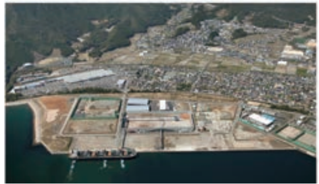
新宮港第二期工業用地全景